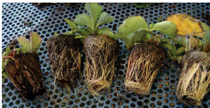
Wortelkluitjes zijn visueel beoordeeld met score 1 t/m 5 (links = 1. slecht en rechts = 5. zeer goed)